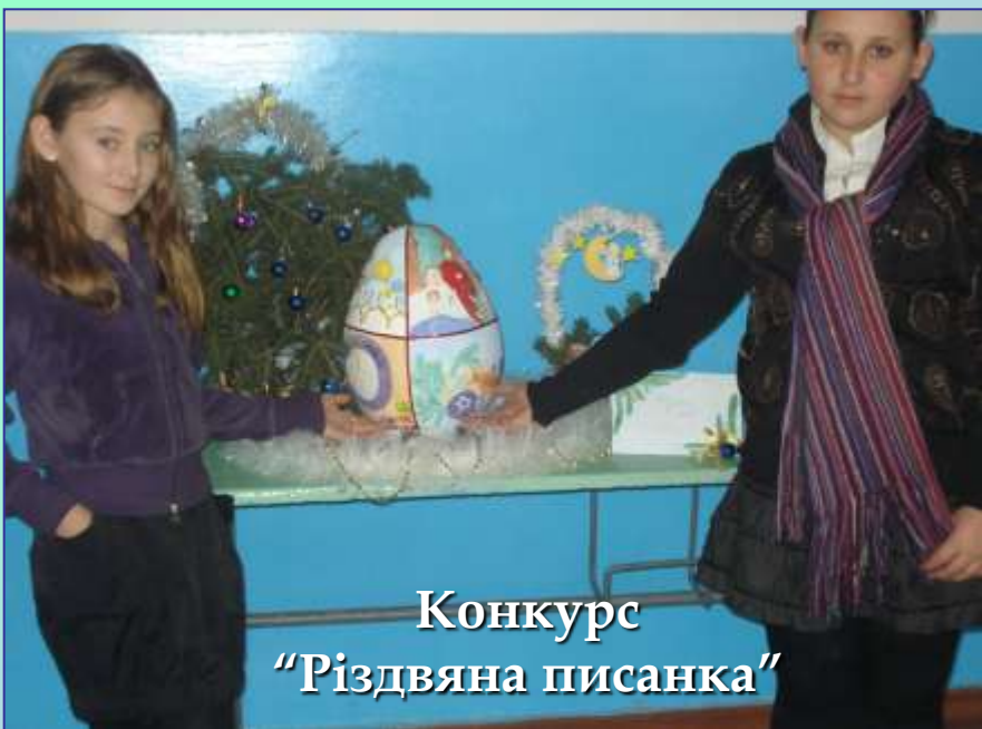
Конкурс "Різдвяна писанка"