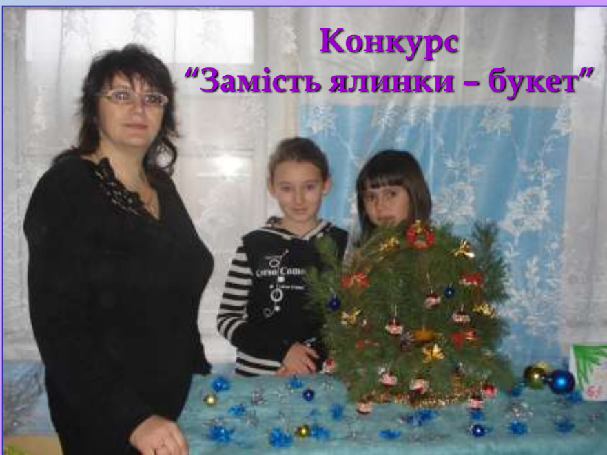
Конкурс "Замість ялинки - букет"