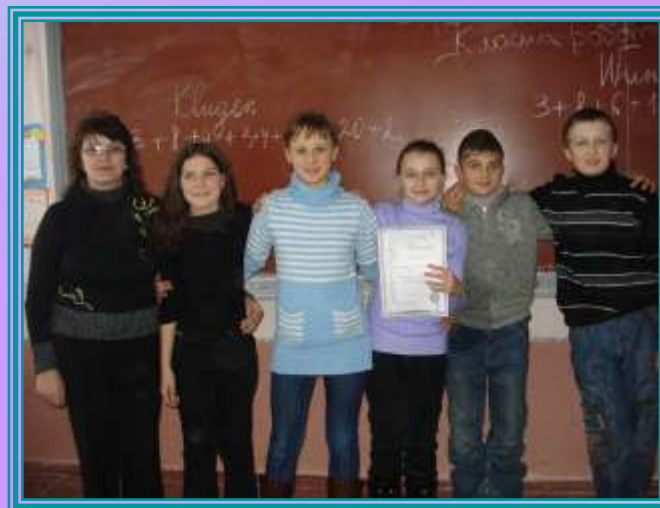
Інтерактивна гра “Свята в Німеччині”