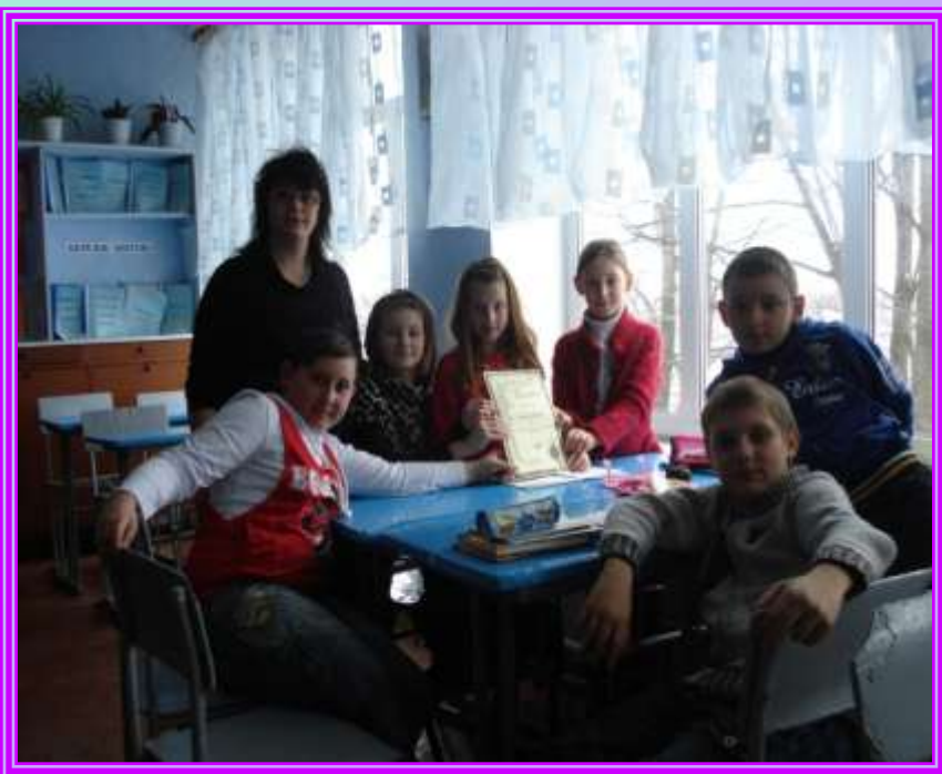
Урок- конкурс “Хто знає німецьку мову краще”