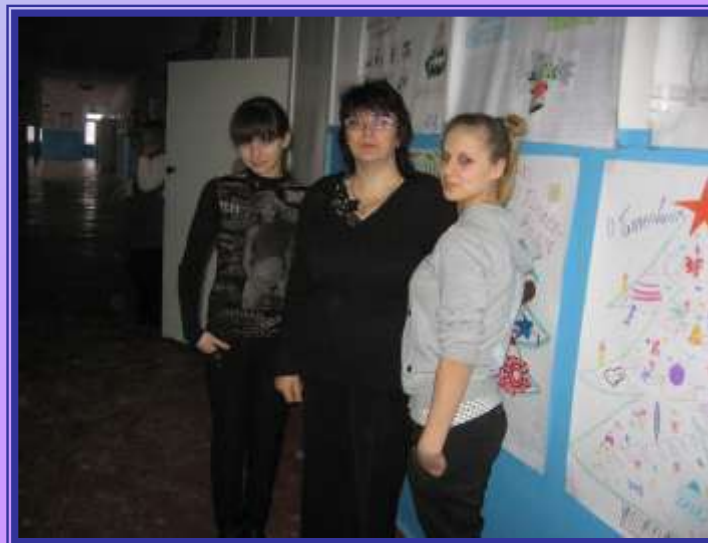
Переможці конкурсу стіннівок