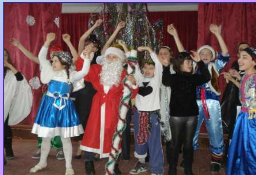
Святкуємо Новий рік