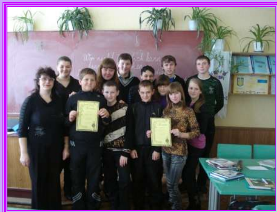
Урок - змагання: “Хто не знає німецької мови, той не вмє думати”