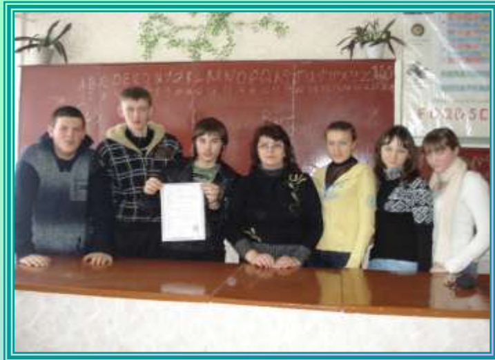
Конкурс знавців німецької мови “Найрозумніший”